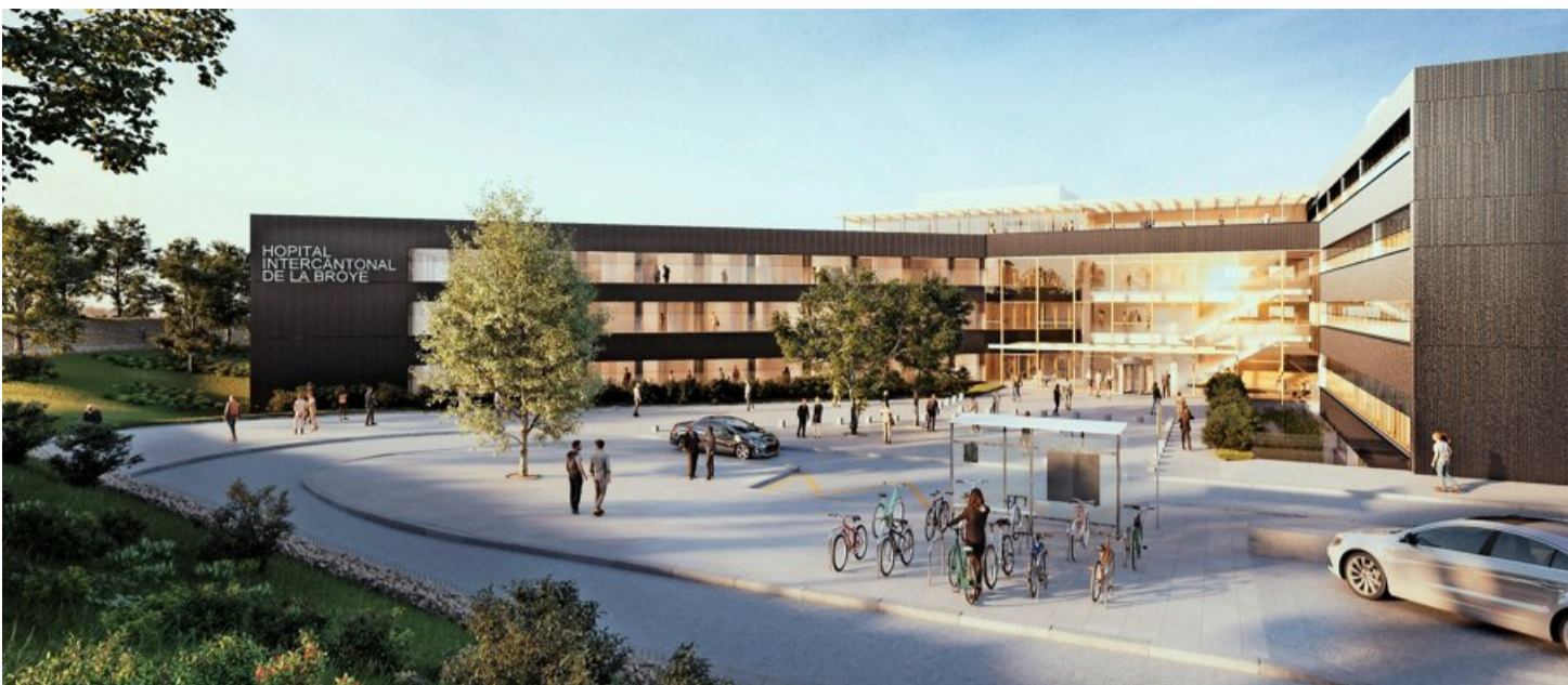
Avec le projet Acte III, l'entrée de l'HIB se situera au centre de l'extension prévue du bâtiment. BRUNET SAUNIER ARCHITECTURE