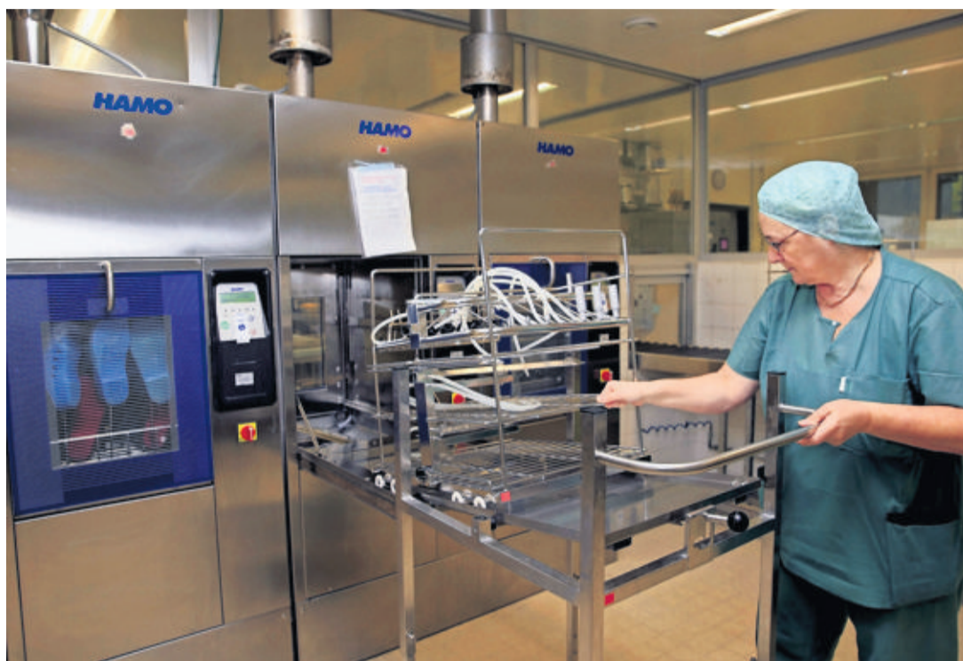
L'actuelle unité de stérilisation du HIB traite quotidiennement des milliers d'instruments médicaux. L'unité provisoire prendra le relais durant les mois de sa mise aux normes. O. ALLENSPACH

«Notre système de stérilisation principal remonte à 2003. Il avait